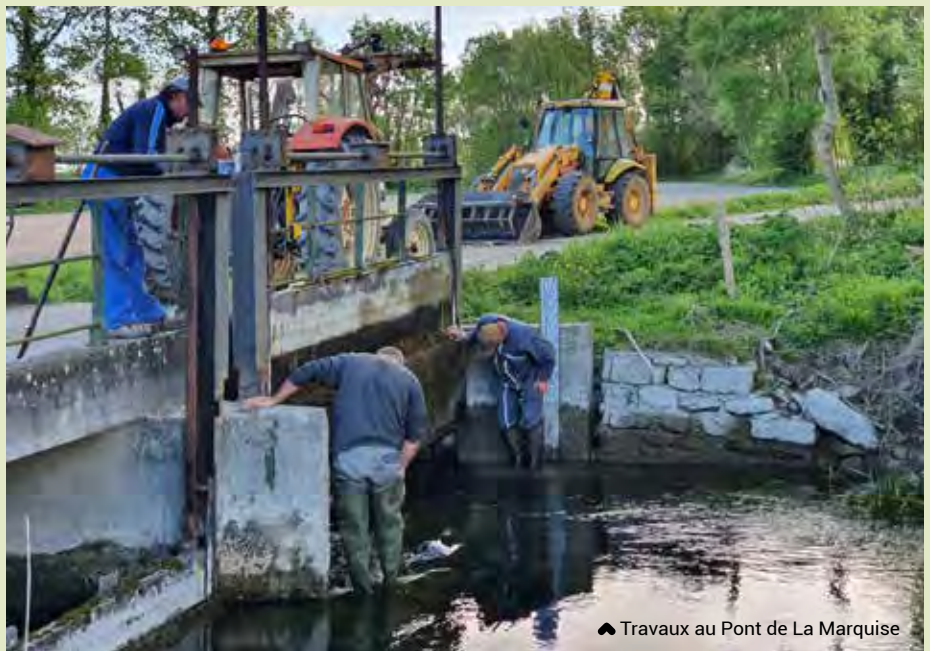
▲ Travaux au Pont de La Marquise

Pendant la période de confinement, les services techniques ont été réorganisés afin de maintenir une continuité de service sur l'entretien de Mauzé. Ainsi, les tontes, les travaux d'entretien de la commune et du Mignon ont été maintenus. Comme les établissements recevant du public sont fermés actuellement, des travaux ont pu être entrepris en respectant les règles imposées par le confinement.