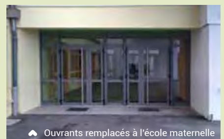
▲ Ouvrants remplacés à l'école maternelle