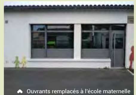
▲ Ouvrants remplacés à l'école maternelle

A l'école maternelle , les ouvrants côté cour ont été remplacés par un système beaucoup plus isolant et une climatisation a été posée dans la salle de motricité.